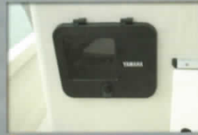
4 ナビゲーターボックスAssy