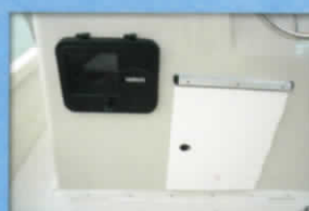
■コンソールハッチ・ナビゲーションボックス(OP)