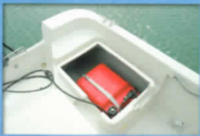
■スターン燃料タンクスペース