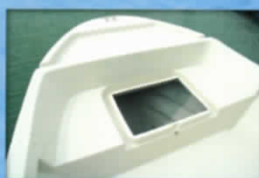
■パワロブロッカー