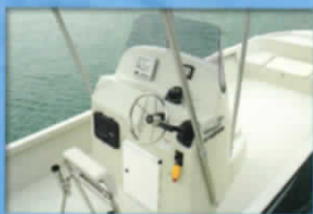
■センターコンソール