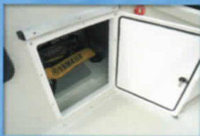
■コンソールハッチ