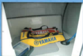
■コンソール内部物入れ