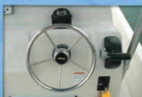
■ステアリングホイール&リモコン