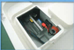
■スターンバッテリースペース