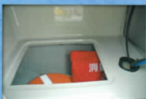
■コンソール内部物入れ