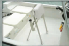
2 リーニングシート