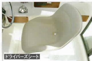
ドライバースシート