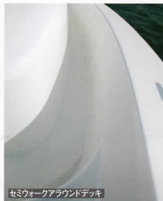
セミウォークアラウンドデッキ