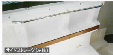
サイドストレージ(左舷)