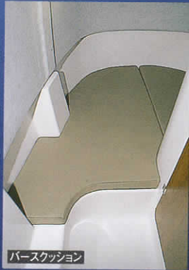
バースクッション