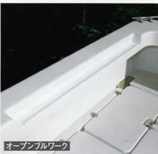
オープンブルワーク