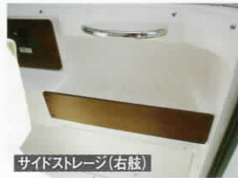
サイドストレージ(右舷)