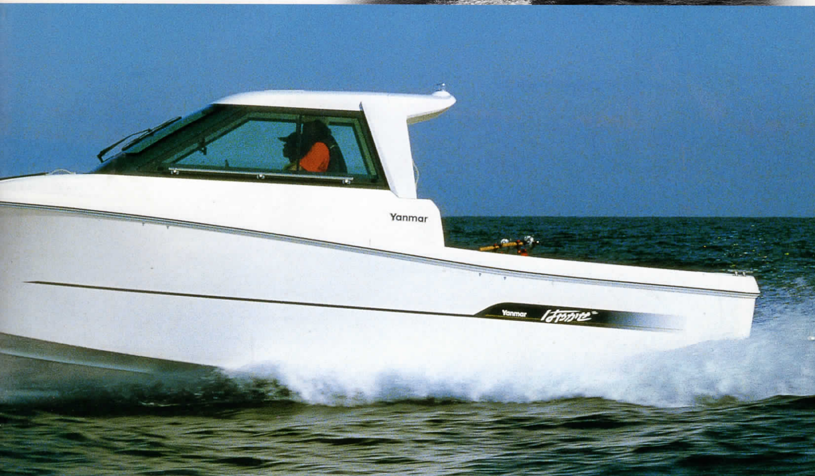
◎本カタログ掲載の写真は、撮影の為に機装品・オプション類などを装備しています。