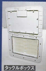
タックルボックス