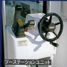
ツーステーションユニット