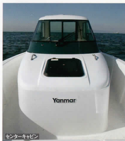
センターキャビン

悪天候時の快適性や係留時のセキュリティを考慮し、引き戸タイプのリアドアを装備したクローズドキャビン。リアドアは間口面積が広いので出入りがしやすく、全面ガラスによって優れた後方視認性と採光性を発揮します。