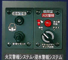
火災警報システム・浸水警報システム