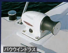
バウウインドラス