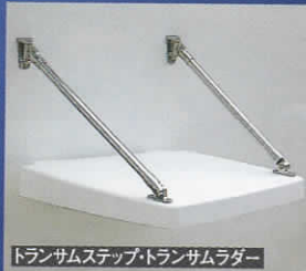
トランサムステップ・トランサムラダー