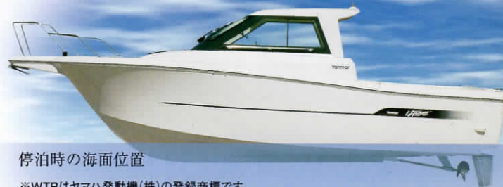
停泊時の海面位置

WTB ※ とスパンカー(オプション)とのマッチングを考慮した洗練のスタイリングが、風による横流れを大幅に軽減。力強く爽快な走りが楽しめます。