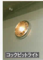
コックピットライト