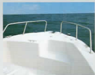
パウレール※工場オプション (先割れタイプ)