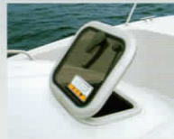
スカイライトハッチ(ベース)