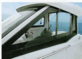
サイド引違い窓(両舷)