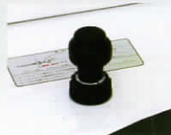
パーニアケープル