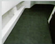
バースクッション