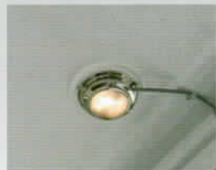
ルームライト(キャビン)