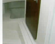
トイレウォール(ドア付) ※工場オプション