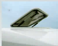
スカイライトハッチ(キャビン)