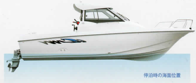
停泊時の海面位置

ブリッジ高さを抑えたローライン設計により、風の抵抗や横流れを軽減し、流し釣りにも最適。さらに全体的な低重心設計により、高速でも心地よい安定走航が行えます。