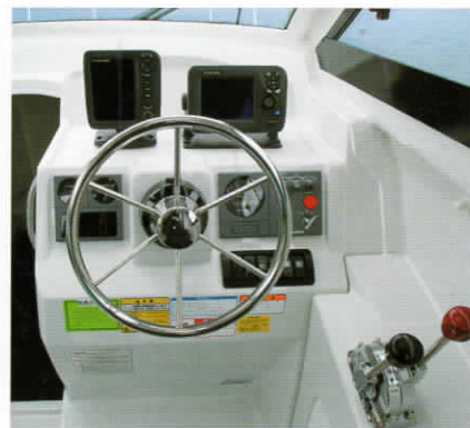
ヘルムステーション