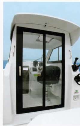
リアスライドドア