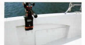
オープンブルワーク