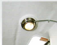
ルームライト(ベース)