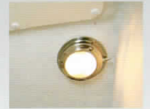
ルームライト(トイレ)