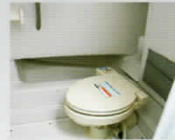
電動マリントイレ