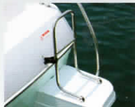
ボーテイングラダー