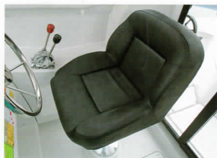
ドライバーズシート