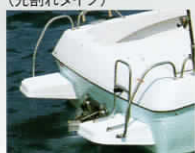
トランサムステップ