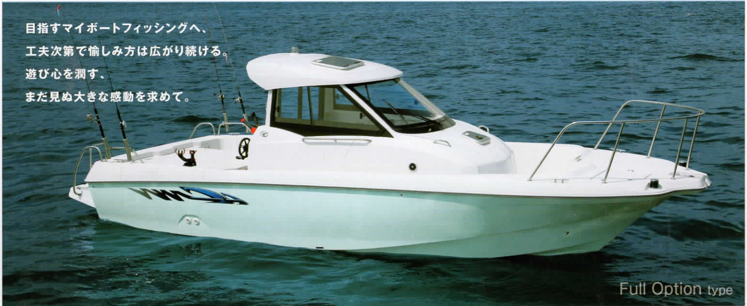
Full Option type

目指すマイボートフィッシングへ、 工夫次第で楽しみ方は広がり続ける。 遊び心を潤す、 まだ見ぬ大きな感動を求めて。