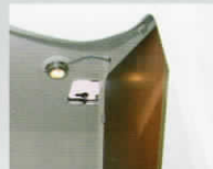
トイレウォール(ドア付)