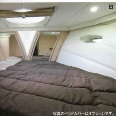
写真のベッドカバーはオプションです。