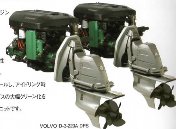
VOLVO D-3-220A DPS

また、1回爆発あたりの噴射を精密にコントロールし、アイドリング時の燃焼騒音低減、および、Nox、PM等、排出ガス的大幅クリーン化を達成するなど、人にも環境にも優しいパワーユニットです。