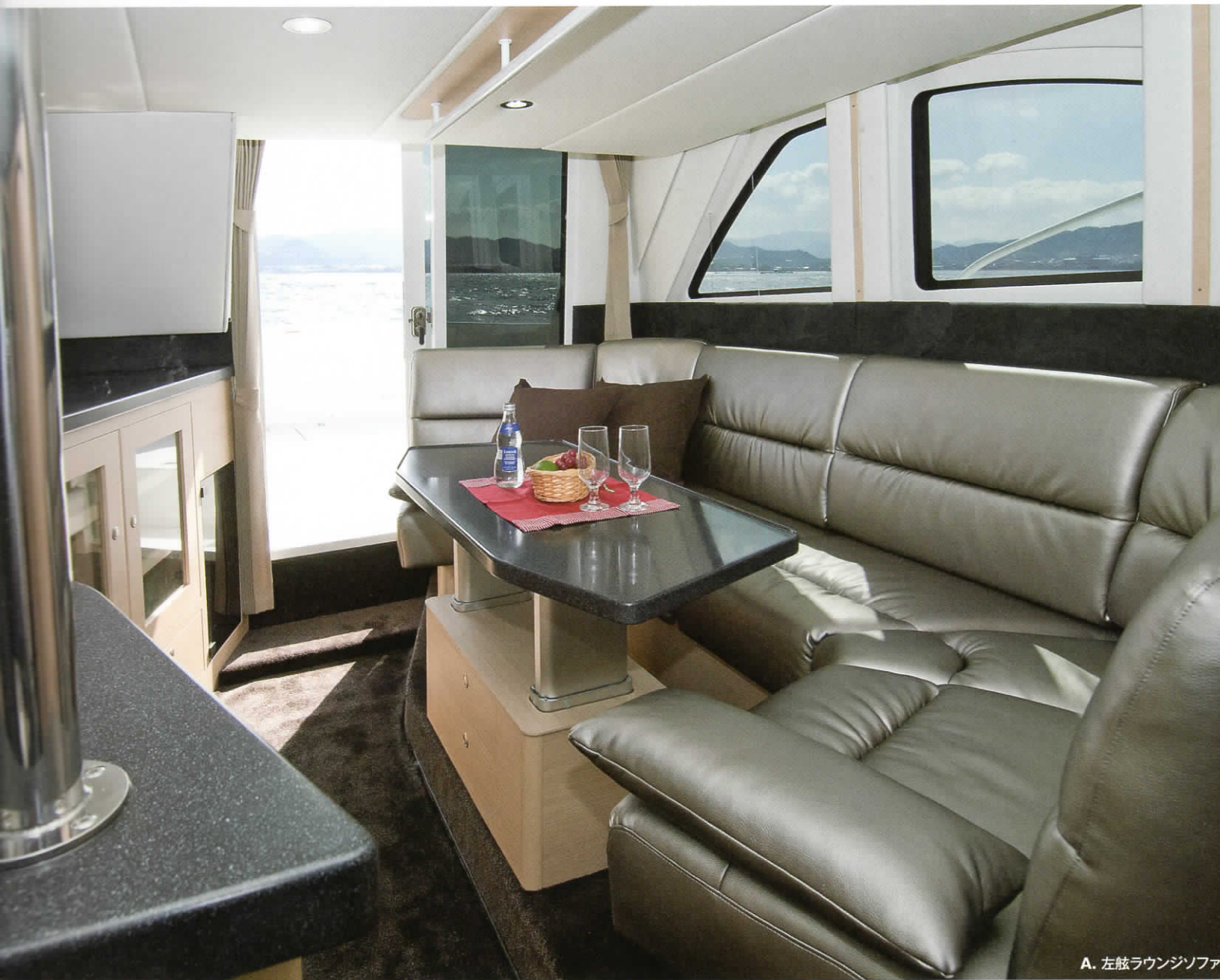
A. 左舷ラウンジソファ