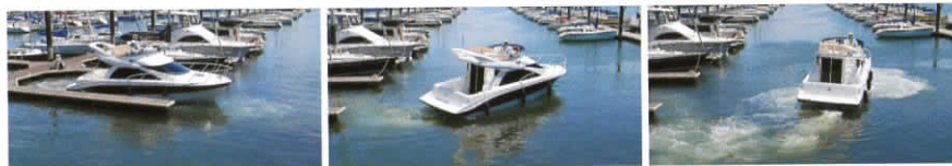
マリーナなどの狭い場所での回頭もジョイスティックリモコンひとつの操作で行えます。