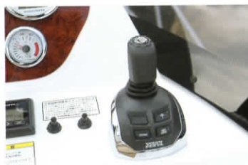
ジョイスティックリモコン1本で360度の回転や、平行移動が可能。

「ジョイスティック・スターンドライブ・システム」は、ジョイスティックリモコンレバーの操作により、ドライブユニットのシフト、スロットル、向きを統合制御し、スラスターなどの補助動力を用いず低速での全方位移動を実現したシステムです。これによって、桟橋からの離着岸や狭い場所での取り回し時に、快適な操船性を実現しました。