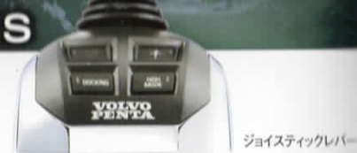
ジョイスティックレバー

SC-30eXは、流麗なヨーロピアンスタイルのデザイン、質感の高い居住空間、卓越した航走性能、そして「ジョイスティック・スターンドライブ」システムによる、優れた操船機能を備え、サロンクルーザーに求められる「快適さ」にさらに磨きをかけるべく開発されました。