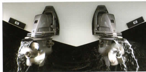
リモコンレバーを倒した方向に応じて、スターンドライブが左右独自の方向に動き、さらに各プロペラの正・逆転、および回転数も併せて、最適に制御され、艇を適切に指示通りの方向に移動させます。